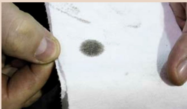
Если масло только что заменили, то крупинки сажи в пятне будут отсутствовать, а сам продукт распределится в виде одноцветного сероватого мазка