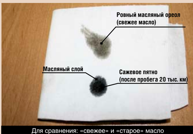
Для сравнения: «свежее» и «старое» масло